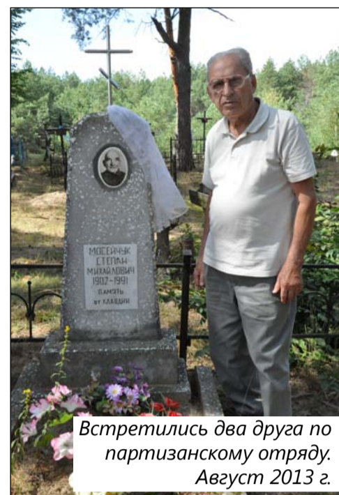
Встретились два друга по партизанскому отряду. Август 2013 г.