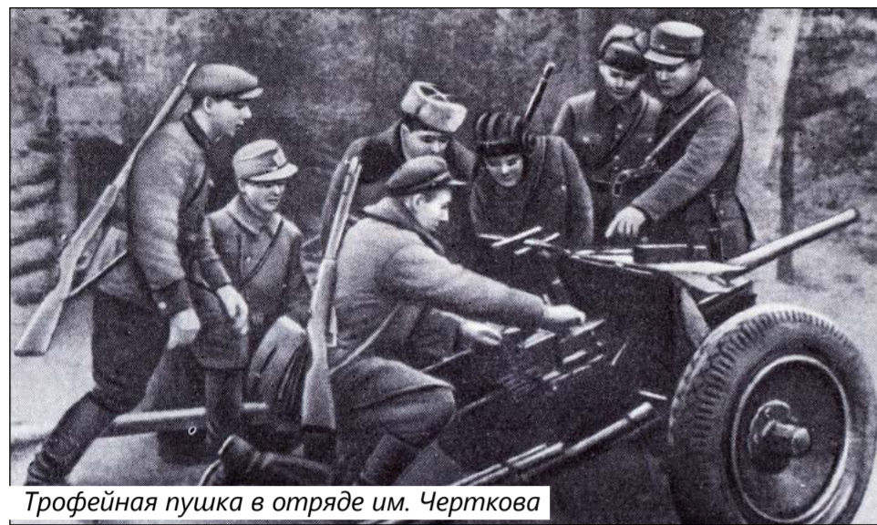
Трофейная пушка в отряде им. Черткова