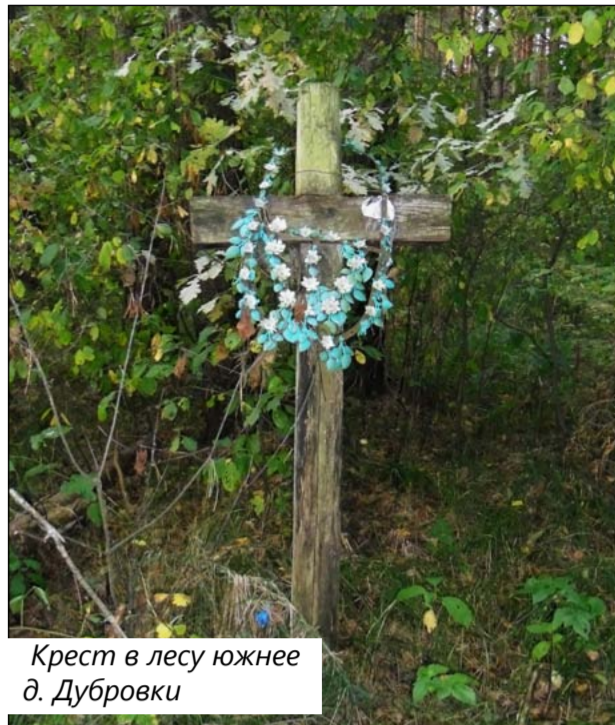
Крест в лесу южнее д. Дубровка