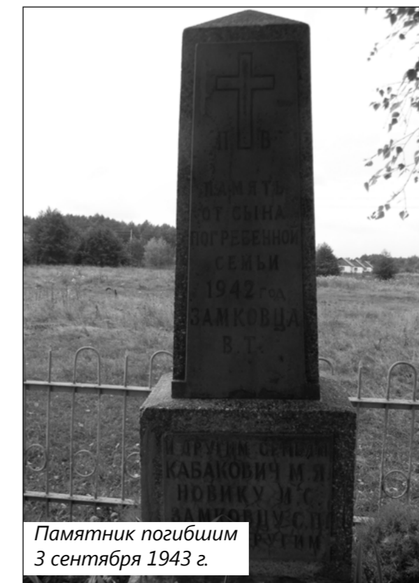
Памятник погибшим 3 сентября 1943 г.

Отца мужа (свёкра) Ивана Федюковича после освобождения от оккупантов призвали на фронт. Он служил в сапёрном батальоне. Во время сооружения переправы через Одер в